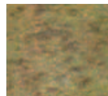
葉枯病(犬の足跡病)